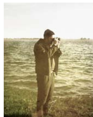
"I Picture the Island", photograph 2012, Johan Thurfjell