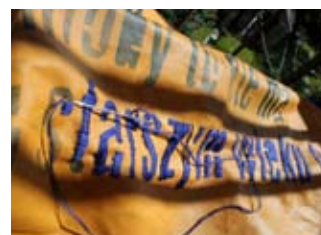
"Patience", hand embroidery on canvas, Iwona Zajac