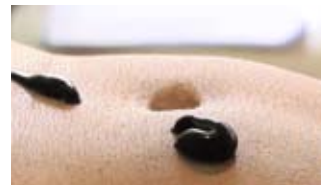
"Semper domestica mare/Inner sea everywhere", video 2012, Oleg Blyablyas