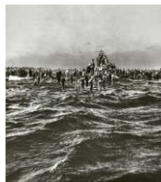
"Deadline", collage, Patrycja Orzechowska