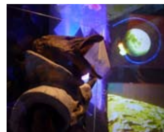
"Cosmos of Fish (Fish in the outer space)", multichannel audio-video installation, object - sculpture 2012, Anna Zaradny