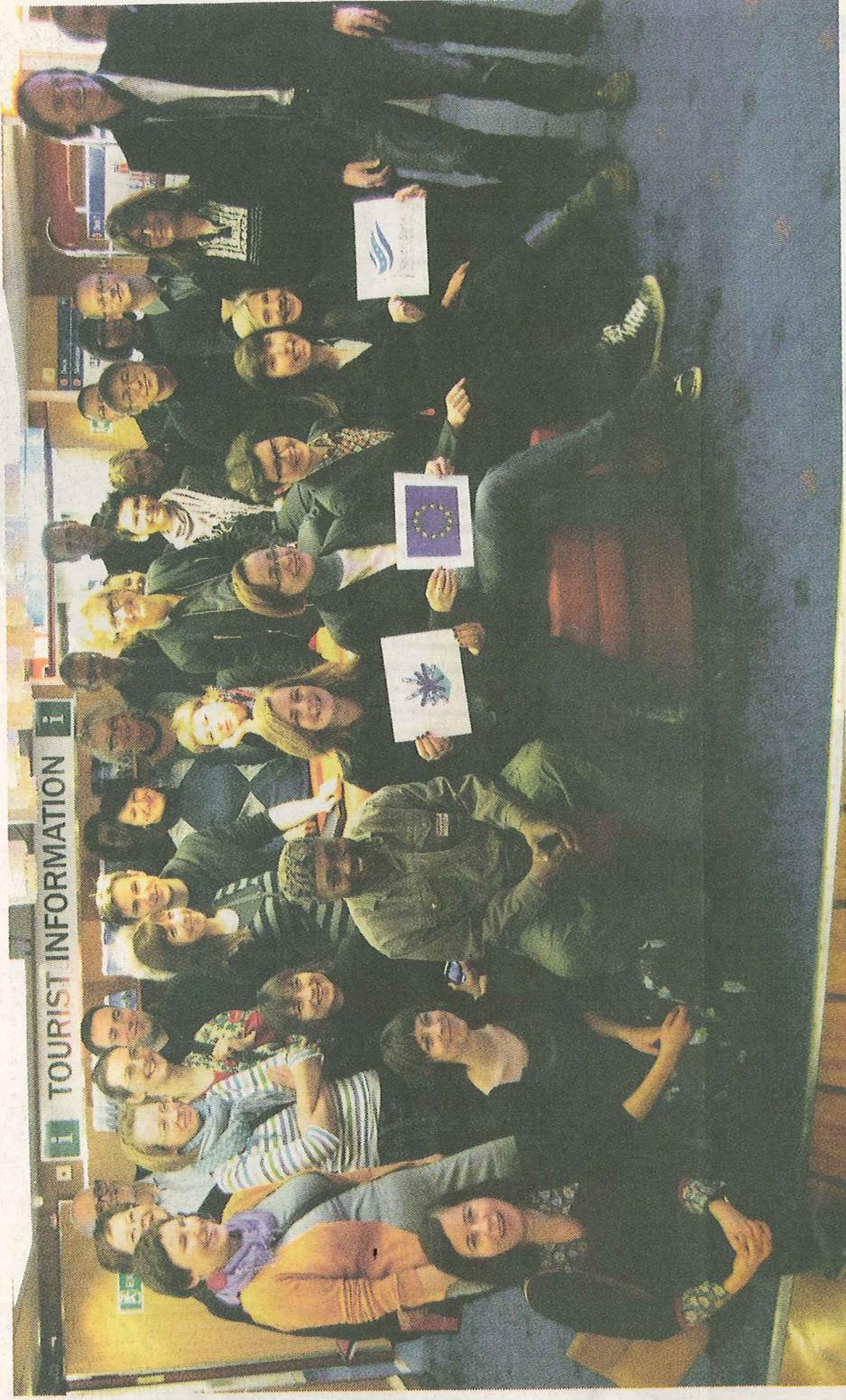
Samling inom Art Line-projektet i Polenfärjans entré för en snabb gruppbild innan avfärd. De lydiga deltagarna håller upp lappar som visar att Art Line är ett EU-projekt.